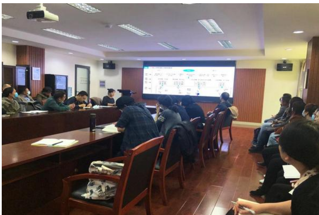
兰芳博士讲座现场