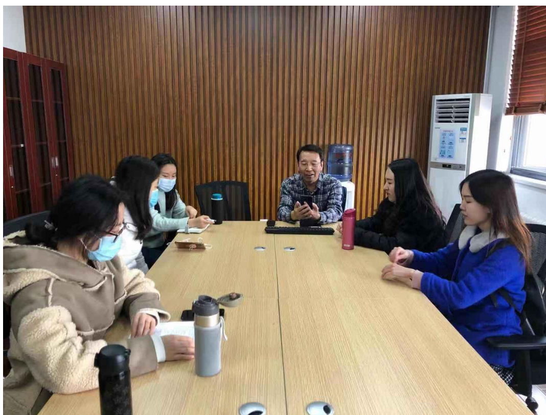
利用网络回答问题