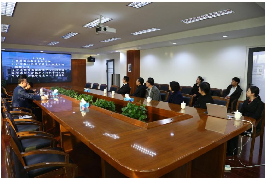
观看教师教学发展中心宣传片