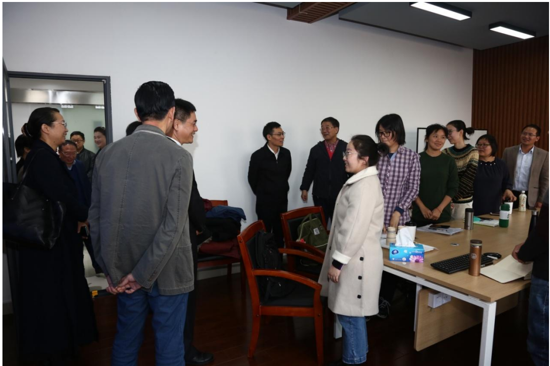
了解名师工作室开展活动情况