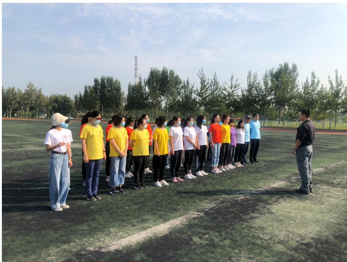
素质拓展培训动员