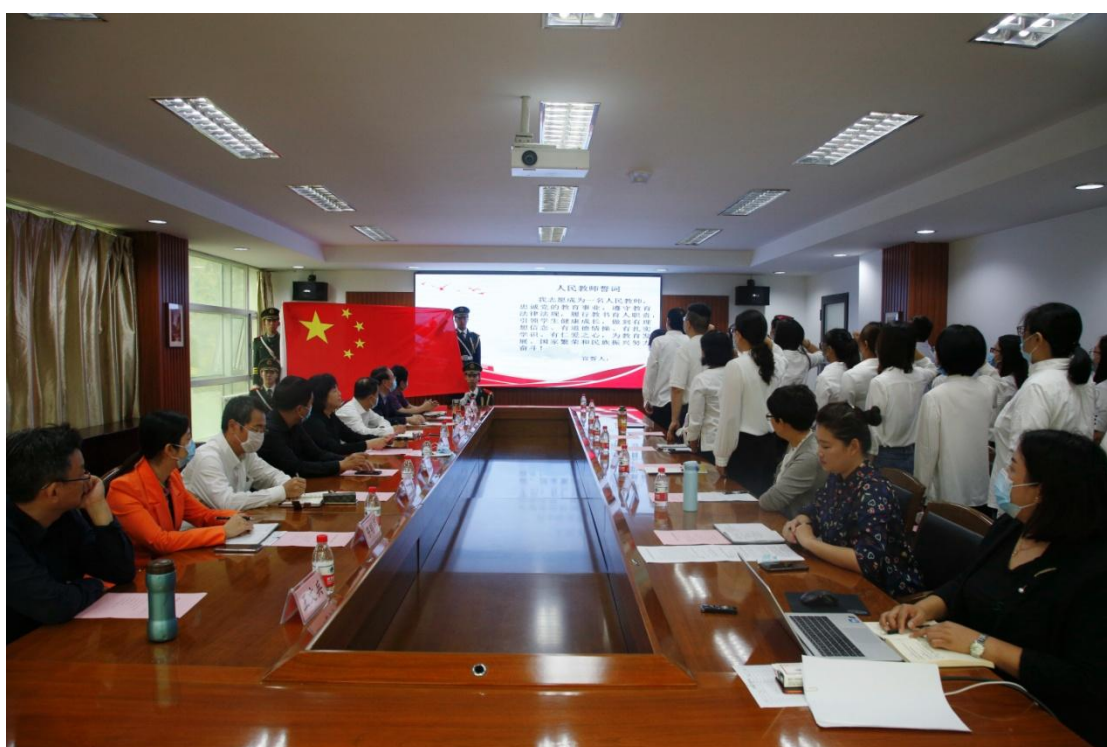
新入职教职工面向国旗宣誓