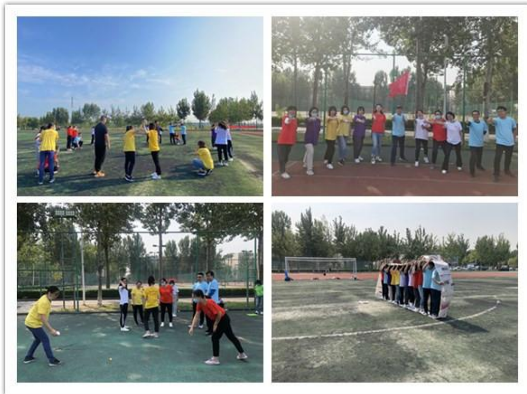
素质拓展培训现场二