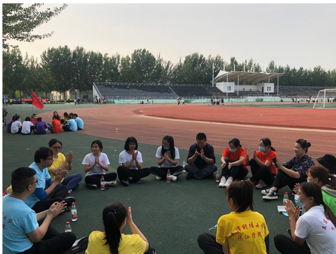
素质拓展总结分享