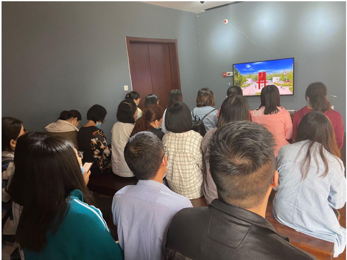
观看校庆宣传片二