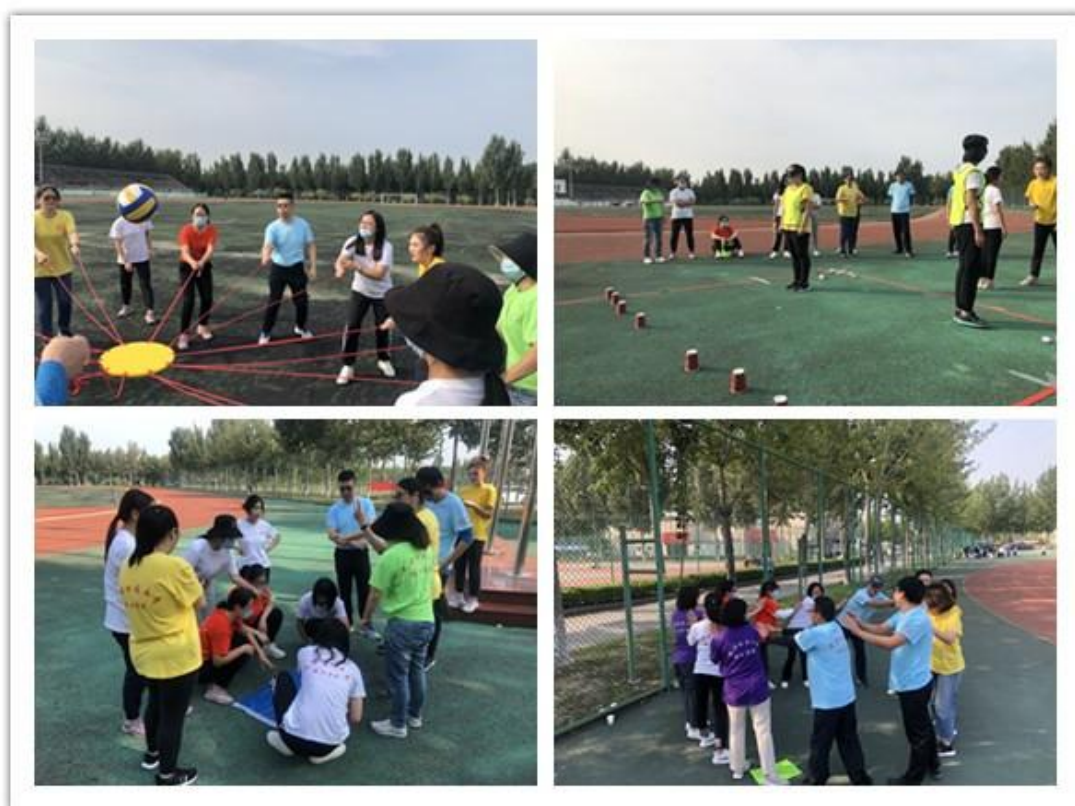
素质拓展培训现场一