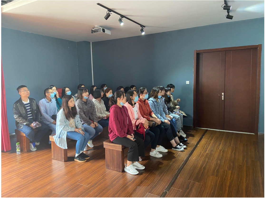
观看校庆宣传片一