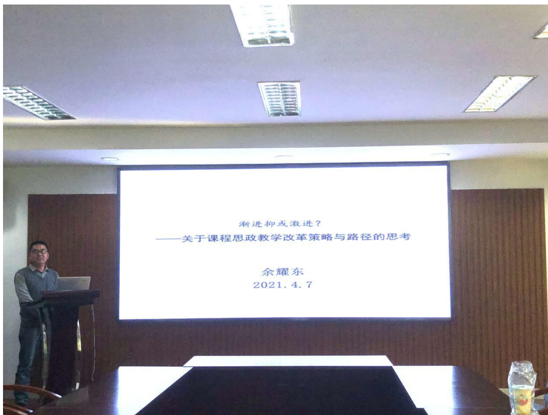
余耀东老师课程思政建设成果汇报