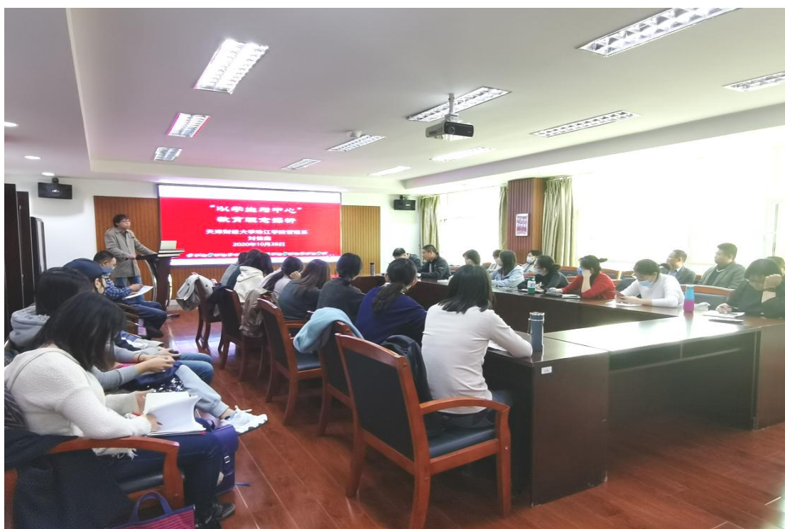
参会教师认真聆听