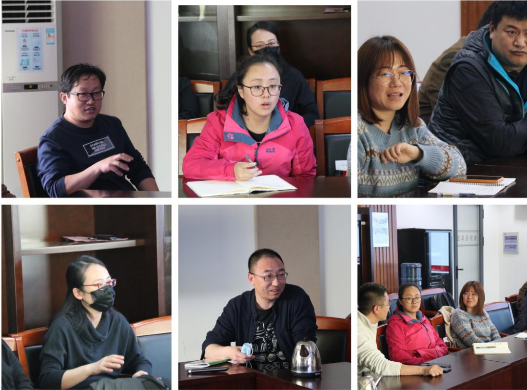
参会教师热烈讨论