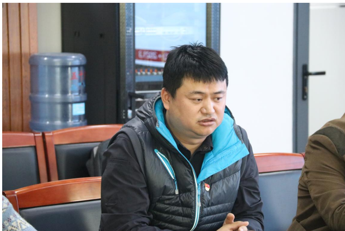
梁如春副部长主持会议并讲话

本次交流会受到参会教师的一致认可，通过创新创业教育为教师跨专业交流和合作建立了新平台，为我院实践育人提供了新的通道。