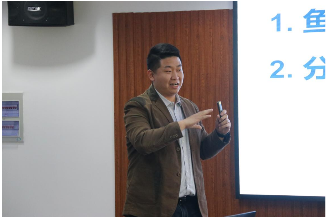
邵阳老师做研究汇报