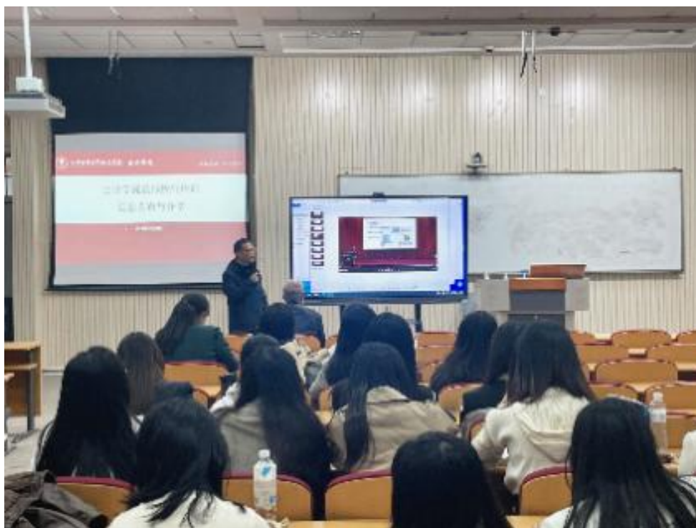
校外培训信息分享会现场