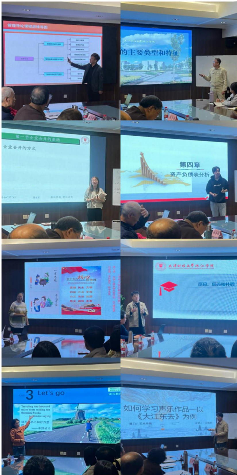
新入职教师课程展示