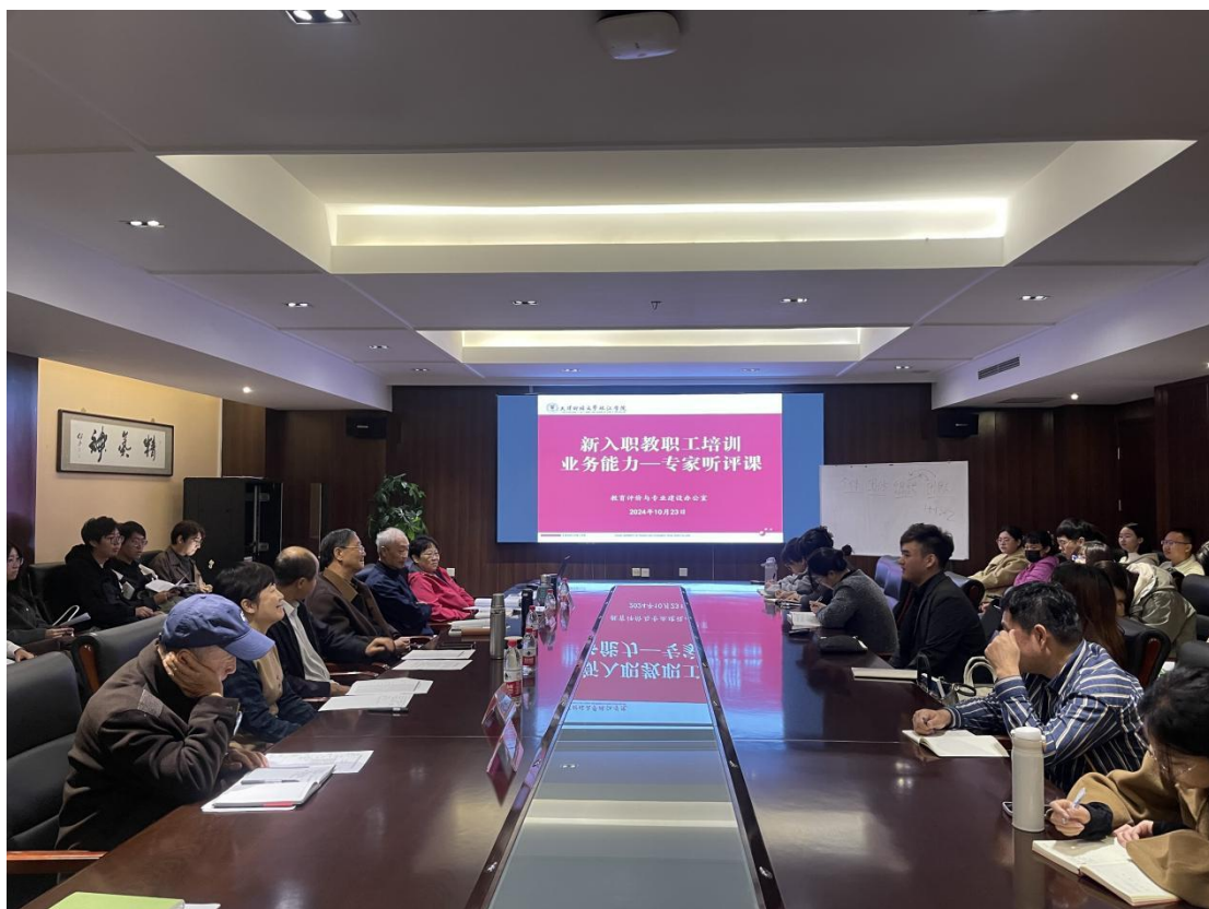
专家听评课工作会议

力护航，继续加强教学质量管理工作，促进新教师快速成长，帮助教师树立正确的岗位意识，提升教学业务水平，加强教学过程监控，积极创造新老教师交流平台，打造高效课堂，助力学院提升教学质量与水平。